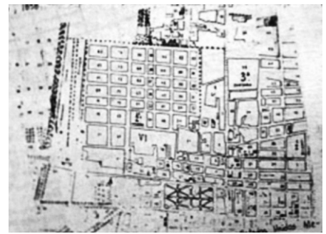
Figura 12. Colonia Buenavista y fraccionamiento de la Colonia Guerrero en 1876 Ciudad de México Liberal Independentista.

Hipólito y el Barrio de la Santa Veracruz ; y posteriormente se desarrollaría el sistema de unidades de barrio generadas o prefiguradas pertenecientes al fraccionamiento de la Colonia Guerrero y al sistema de barrios de la "Ciudad Liberal Independentista": el Barrio de Buenavista y el Barrio de Vicente Guerrero (originario del fraccionamiento) (Figuras 11 y 12). Sistema de unidades de barrio que tiende a establecer relaciones eco sistémicas con el sistema regional de