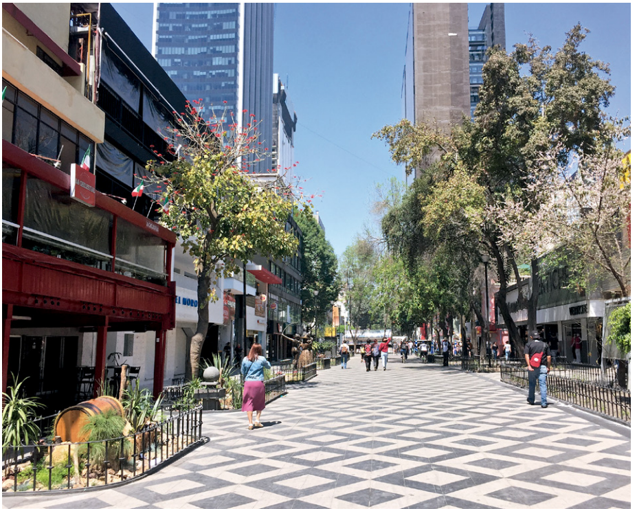
▲ Figura 1. Barrio del porfiriato que se disuelve o transforma. Colonia Juárez, Ciudad de México.

Problemática de la relación establecida entre el barrio y la ciudad, en donde “el barrio” aparece como una entidad ontológico existencial , como “núcleo básico de vida social” (Lefebvre, 1973) (Figura 2) y comunitaria que tiende a expresarse como una forma de organización social del espacio habitable (Castells, 1976; González, 1987), para finalmente definirlo como una forma de Ser y de existir, de vivir y de habitar en “la ciudad” (Lee, 2008), al grado tal que los procesos de apropiación (histórica, física, étnica, social y cultural) del territorio de los “barrios”, procesos de “urbanización sociocultural” (Tena, 2007) terminan, a su vez, por convertirlos en espacios de identidad , en portadores de cultura y en lugares de memoria, tradición y modernidad ; procesos de organización, coordinación y reorganización complejos (multidimensionales y multitemporales) que los presentan como un conjunto de organismos o “sistemas vivos” (Capra, 2006), capaces de organizarse en sistemas de células