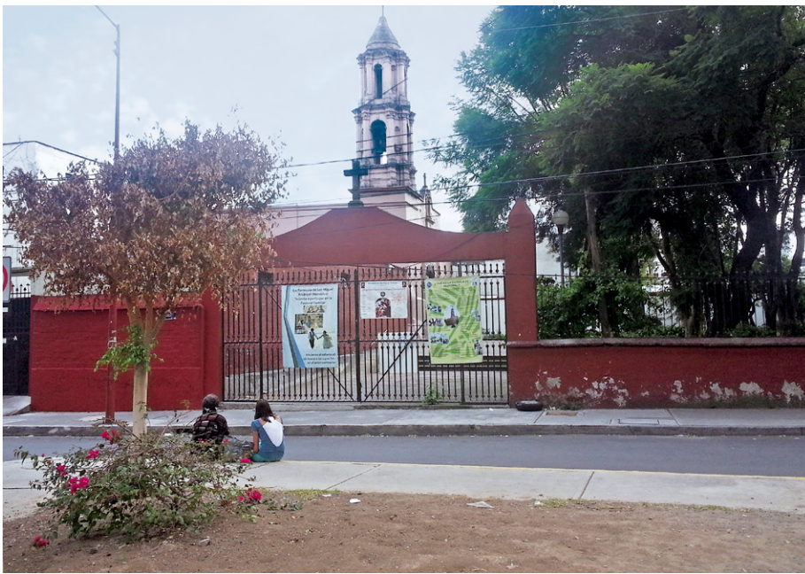
Figura 10. Barrio originario de San Miguel Arcángel Nonoalco, Colonia Guerrero, Ciudad de México Colonial.