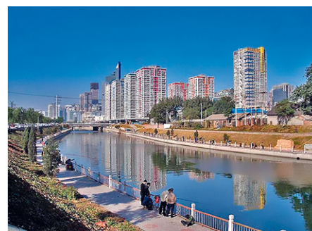
Figura 7. Proyecto de barrio de nuevo tipo. Barrio del Soho, Ciudad de Beijing, China.

2) Sistemas de proyectos de utopía de barrios , sistema de proyectos estratégicos de barrio, sustentables y habitables; sistemas de proyectos estratégicos de sustentabilidad integrales (sustentabilidad histórico cultural, ecológico ambiental, económico productiva, social comunitaria, jurídico política, científico tecnológica y diseño, planeación y desarrollo); y sistemas de pro-