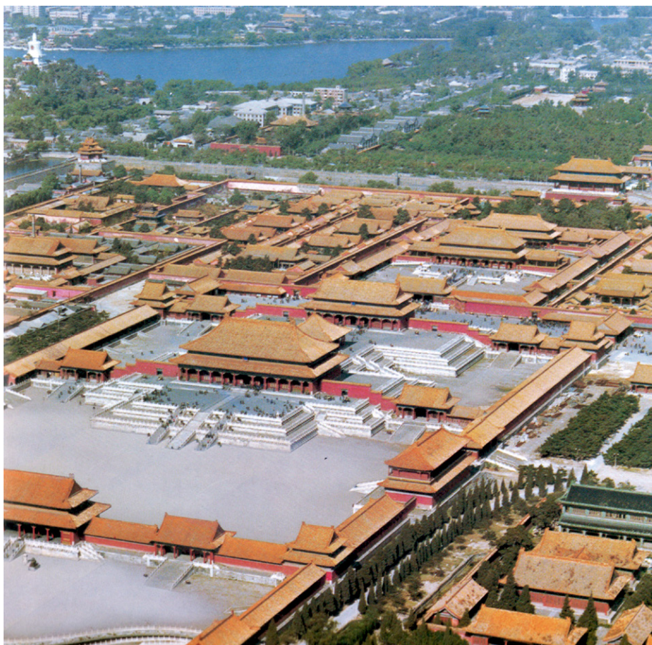
Figura 6. Ciudad testimonio. Sistema de barrios de la Ciudad Prohibida, Beijing, China.

Por lo que repensar y proyectar la ciudad a partir de las formas de organización, formas de auto-co-re-organización de sus barrios y sus sistemas de barrios nos permiten conformar dicho “Modelo de estrategias de eco desarrollo, sustentables y habitables” como una propuesta alternativa de eco desarrollo barrial y urbano sustentada en “ estrategias de barrio, estrategias de clase que, en el mejor de los casos, sean sostenidas por una ideología o visión del mundo propia del pensamiento complejo; paradigma eco-bio-anthropo-social que tiende a incluir las visiones múltiples, complejas y contradictorias del paradigma capitalista neoliberal/paradigma democrático y socialista, como “gran paradigma” (Morin, 1990); modelo de estrategias prospectivas de desarrollo, modelo de estrategias de futuro alternativas (factibles, probables, posibles y deseables), estrategias de desarrollo, innovación, cambio y transfor-