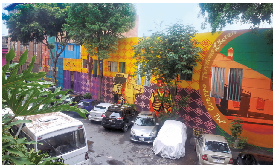
Figura 4. Forma de Ser y existir, de vivir y habitar del Barrio de Santa María Cuepopan, Colonia Guerrero, Ciudad de México.

De ahí la importancia de repensar y proyectar la ciudad a partir de sus barrios, como estrategia, a partir de dicho “Modelo estratégico de eco desarrollo sustentable y habitable” en donde el análisis del complejo cognoscitivo de los barrios y sus sistemas de barrios como “esencia del Ser y existir” de la ciudad nos permite estructurar dicho mo-