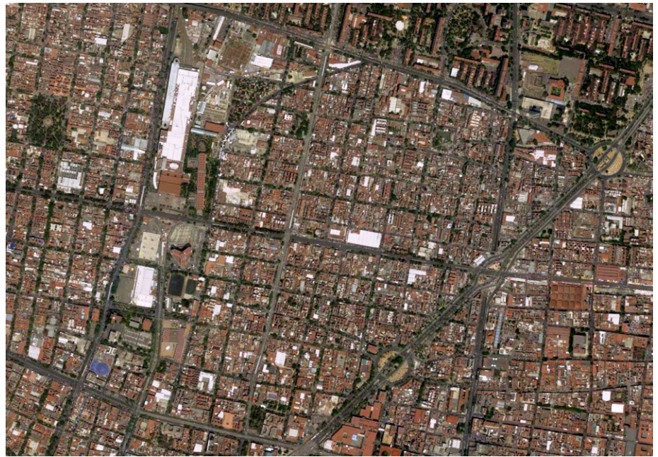
Figura 8. Colonia Guerrero, Ciudad de México.

Modelo de estrategias de conocimiento, organización y de acción que nos permite, a su vez, definir el diseño de estrategias de eco desarrollo barrial para cada uno de los componentes del ya citado sistema de barrios de la Colonia Guerrero, así como de los que forman parte del sistema generativo de ciudades de dicha “Ciudad del Interior”, mismo que consiste en el sistema de “unidades de barrio genésico-generativas” que pertenecen a la “Ciudad de México Tenochtitlan” (Ciudad Fundacional) (Figuras 9 y 10) y posteriormente a la Parcialidad de Santiago