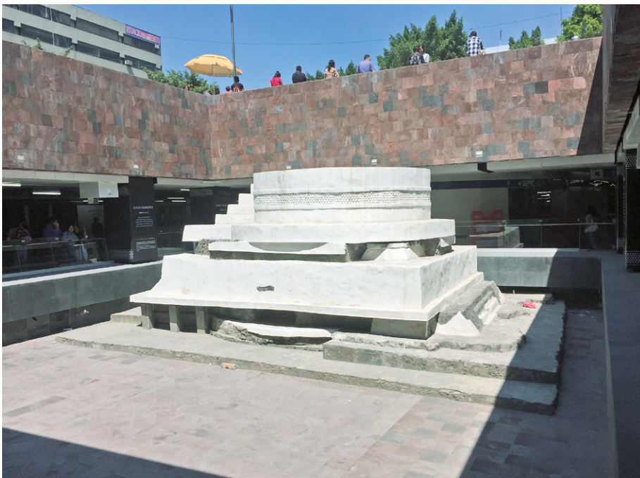
Figura 15. Barrio de San Pablo Teopan del Campan originario de la Ciudad de México Tenochtitlan, Área Metropolitana de la Ciudad de México.