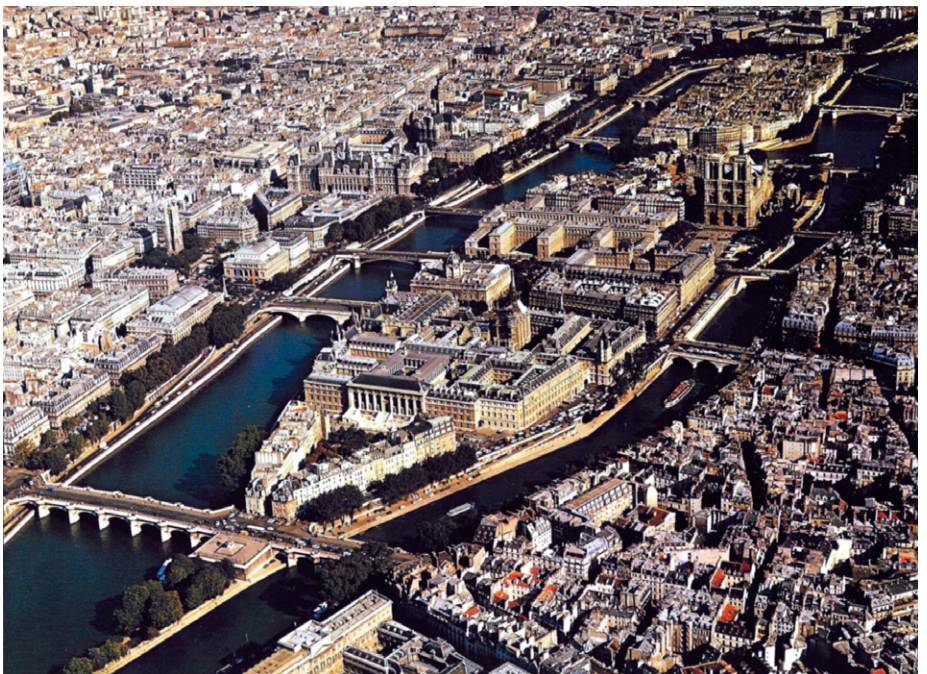
▼ Figura 3. Unidad ecosistémica barrial y urbana de la Cité, Ciudad de París, Francia.