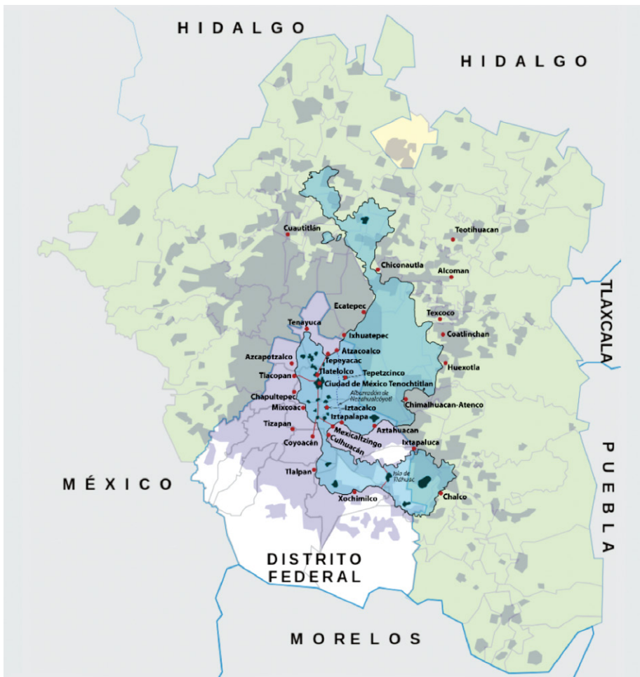
Figura 14. Sistema de Barrios y Pueblos originarios de la Ciudad Fundacional (posibles perímetros C y E del Centro Histórico), Proyecto Heptacentenario de Ciudad de México Tenochtitlan 1325-2025 (escenario de futuro deseable).

eco desarrollo barriales que dependen de las características y propiedades situacionales (onto-geno-fenomenológicas y morfo-topo-topológicas) de sus barrios que terminan por definir tanto las formas de Ser y existir, de vivir y habitar de sus sistemas regionales barriales y urbanos como las estrategias de diseño y planeación múltiples de la propia Ciudad del Interior.