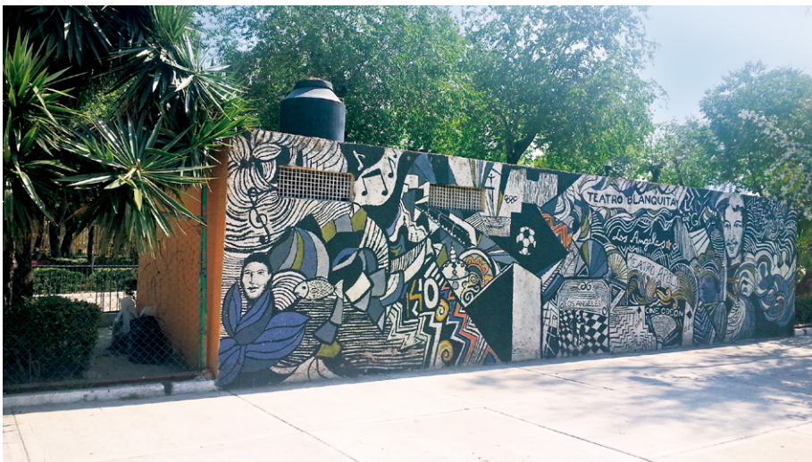
Figura 16. Barrio de los Angeles Cohuatlán, originario de la Ciudad de Tlatelolco, Área Metropolitana de la Ciudad de México.

De tal modo que el proceso de diseño y planeación prospectiva y participativa de los habitantes de dichos barrios y sistemas de barrios se traduce en procesos participativos de diseño, producción y desarrollo colectivo, procesos creativos de participación social y comunitaria, solidaria, colaborativa y cooperativa generados por los propios habitantes de la Colonia Guerrero como "proyectos de utopía barrial", proyectos estratégicos de eco desarrollo barrial que se integran, como estra-