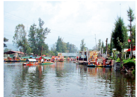
Figura 18. Barrio del Pueblo originario de Xochimilco, Área Metropolitana de la Ciudad de México.