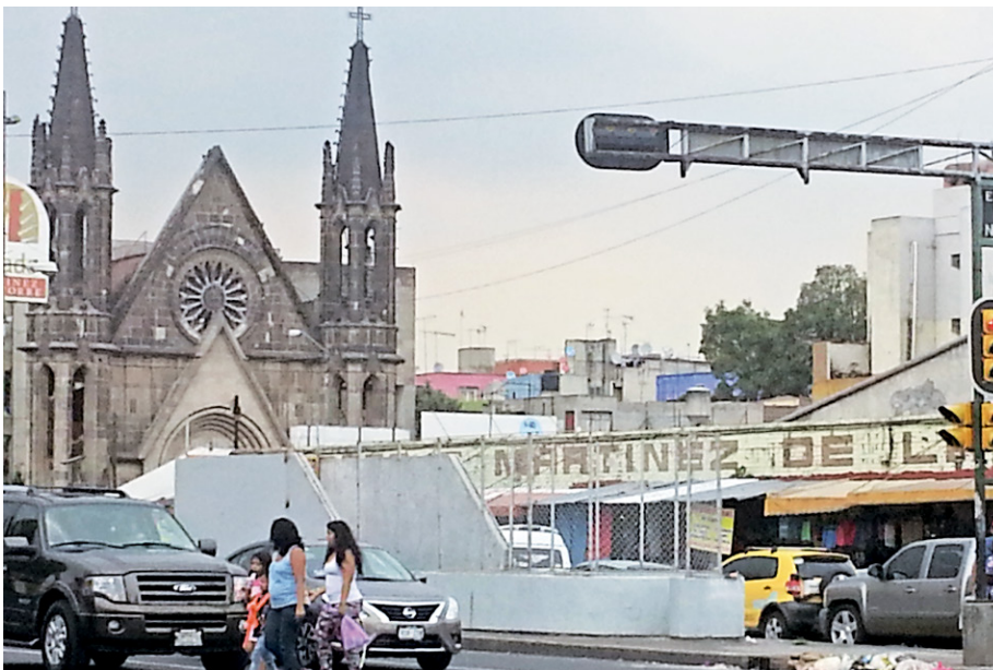
Figura 11. Barrio originario del fraccionamiento de la Colonia Guerrero, Ciudad de México Liberal.

Tlatelolco de la República de Indios, como unidades de barrio regeneradas que forman parte de la Ciudad Colonial: el Barrio de Santa María Cuepopan, el Barrio de los Ángeles Cohuatlán, el Barrio de San Miguel Arcángel Nonoalco y el Barrio de Santiago Tlatelolco . Paralelamente se desarrollaría el sistema de unidades de barrio generadas que pertenecen al sistema de unidades de barrios de la "Ciudad de los Españoles" ( Ciudad Colonial ): el Barrio de San Fernando, el Barrio de San