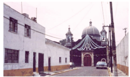
Figura 17. Barrio del Pueblo originario de Iztacalco, Área Metropolitana de la Ciudad de México.