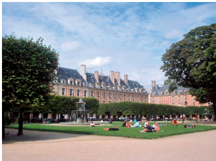
◀ Figura 2. Núcleo básico de vida social. Barrio de los Vosgos, ciudad de París, Francia.