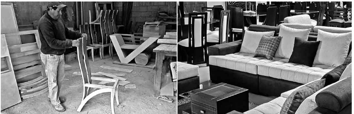
Figura 7. Entorno productivo: mueble de madera.