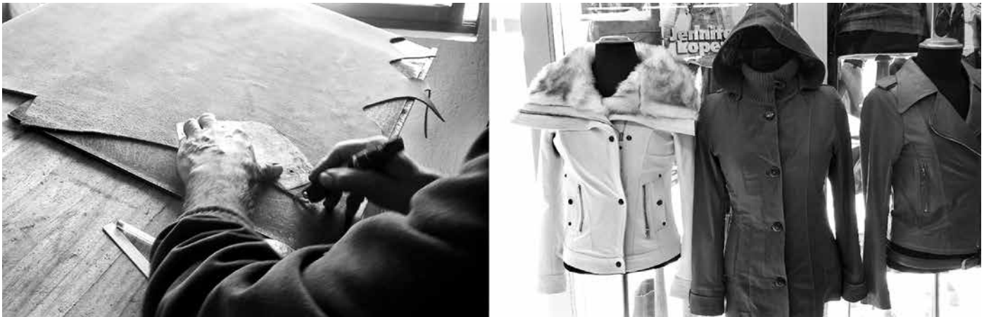
Figura 4. Entorno productivo: prendas de piel.

la maquila, en los que parte de la producción se realiza en otros talleres. Este modelo permite que los talleres tengan pocos empleados fijos y que en cada población existan familias especializadas en etapas concretas o complementarias de la elaboración de un producto; como ejemplo tenemos el tapizado de muebles, el tinturado de telas o el armado de ciertas partes de los productos. Los vínculos familiares son importantes en estos emprendimientos, ya que existen relaciones de parentesco entre artesanos que realizan actividades principales y complementarias.