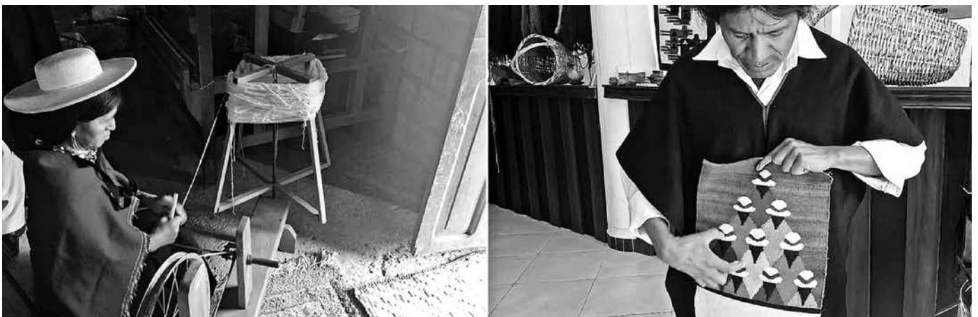
Figura 6. Entorno productivo: tejido tradicional.