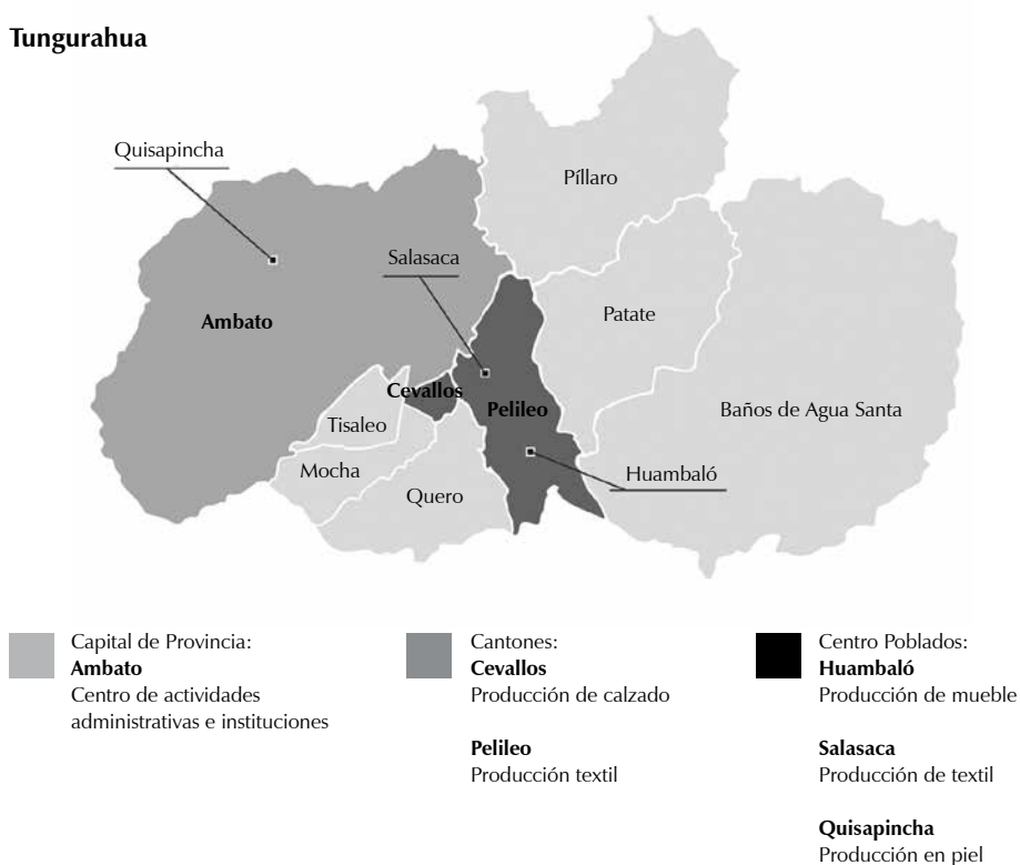
Figura 2. Distribución de sectores productivos en Tungurahua: piel y calzado, textil y mueble.

intervienen productos culturales, creativos y de innovación y desarrollo [I + D].