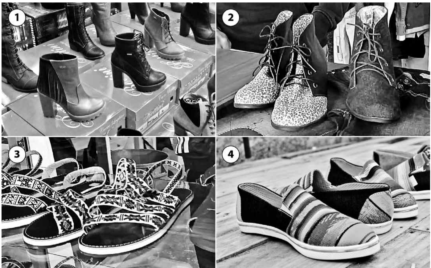
Figura 9. Variantes de productos.