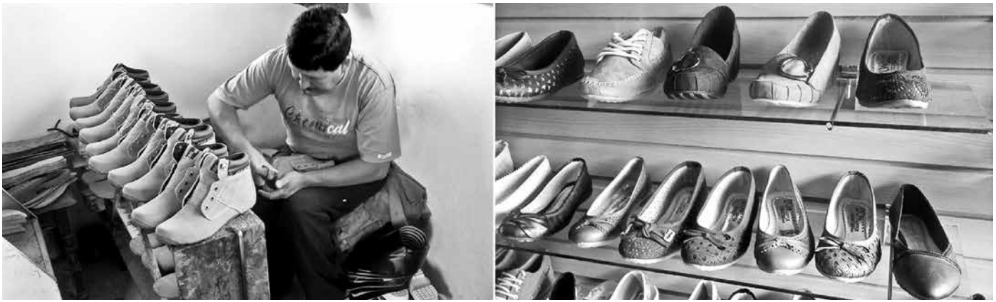
Figura 3. Entorno productivo: calzado.