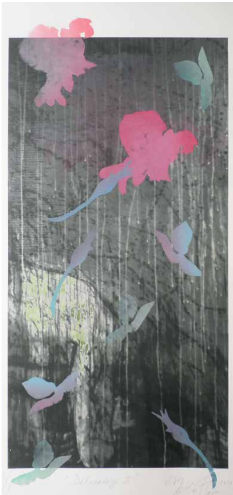
Delicadeza II Martha Flores Mixta sobre papel de algodón 110 × 50 cm 2014