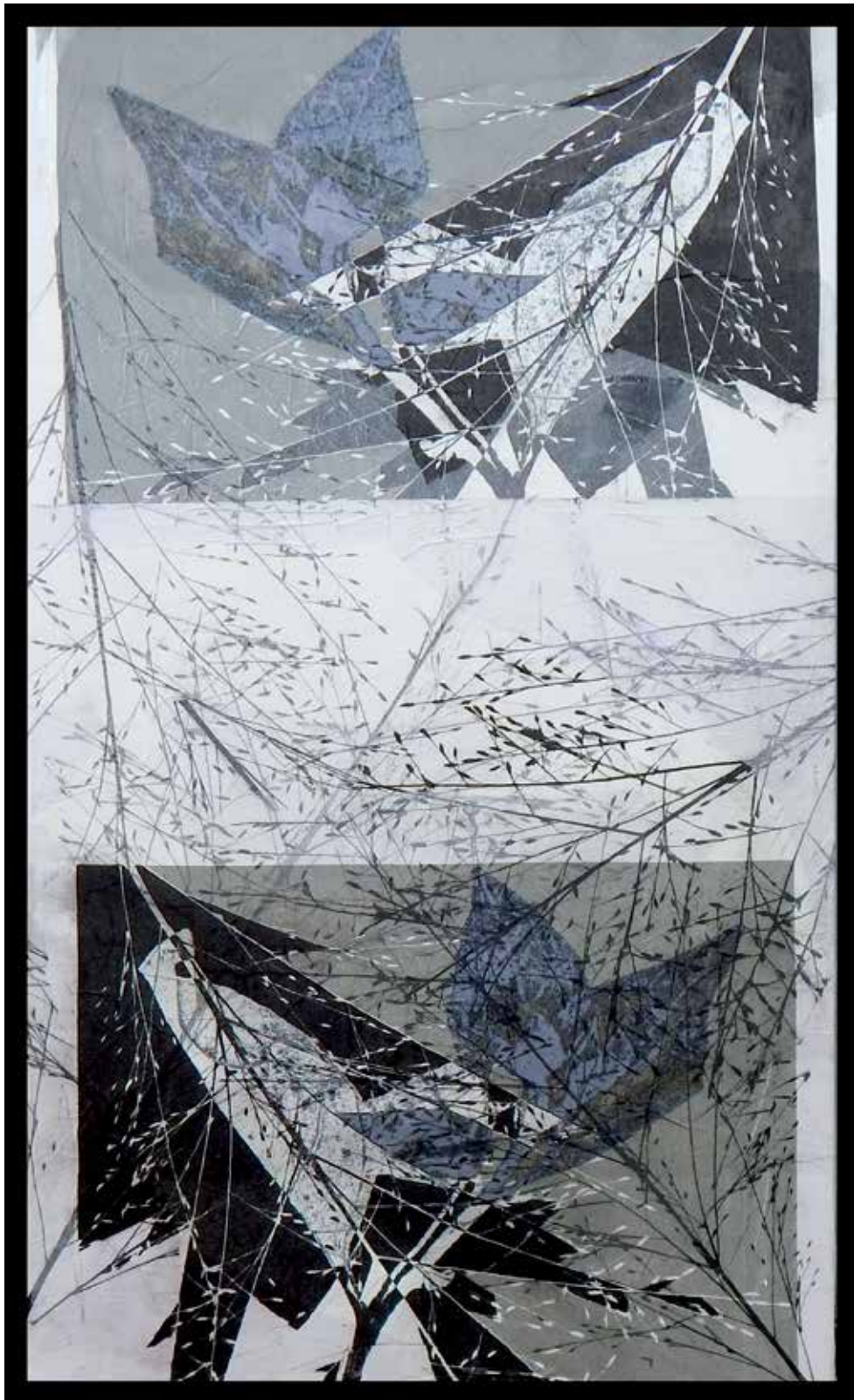
Eragrostis Diana Guzmán Mixta sobre tela 122 × 66 cm 2014