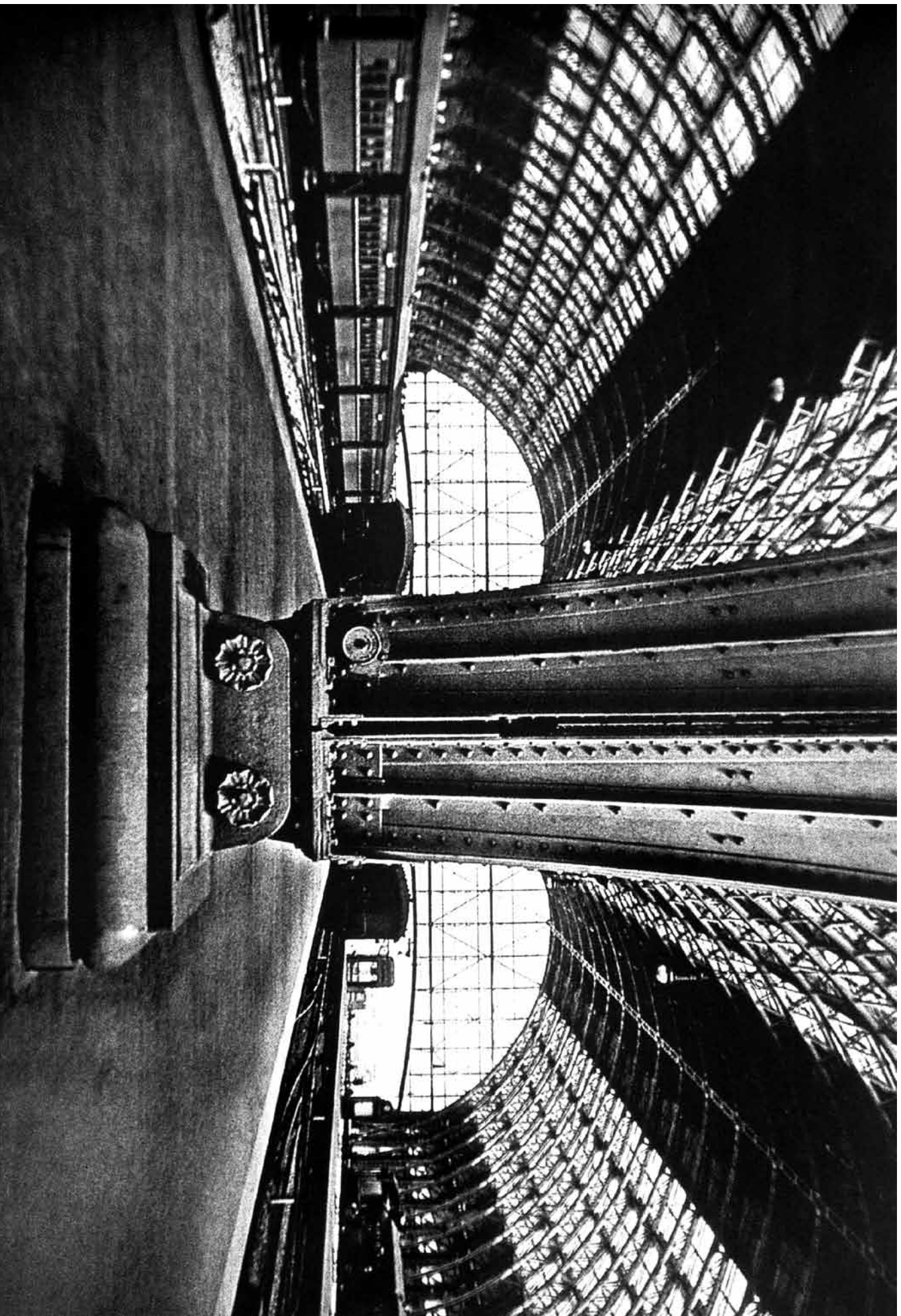
Terminal Retiro del F. C. Central Argentino en Buenos Aires. Datos e imagen obtenidos en Jorge D. Tartarini, Arquitectura Ferroviaria , Ediciones Colihue, Buenos Aires, 2001.