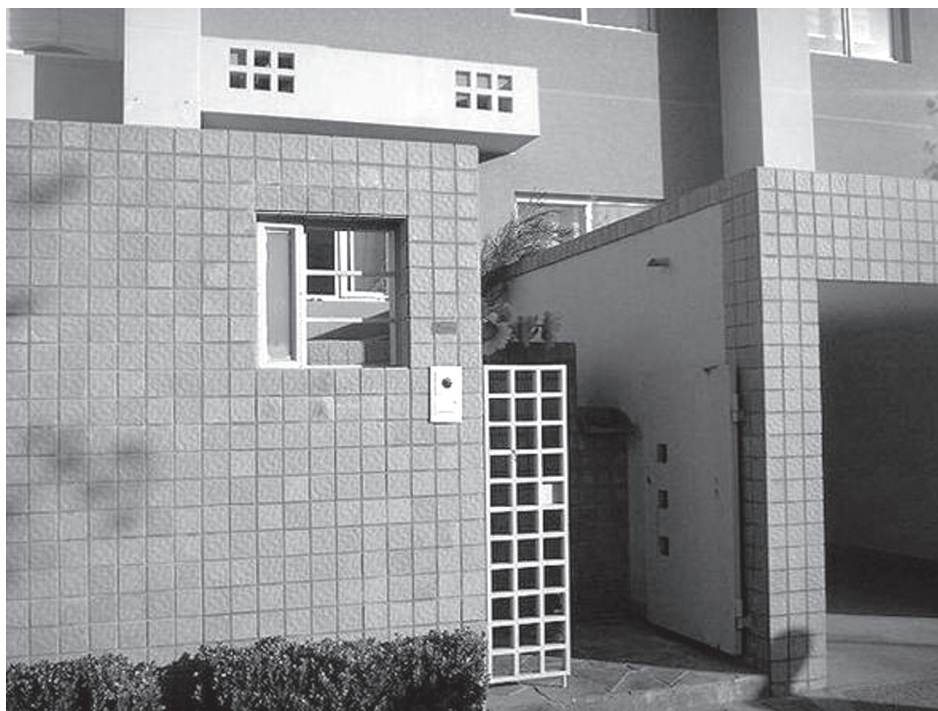
Detalle de acceso a edificio de departamentos.

El proyecto del Soho fue el primero en proponer una pequeña oficina para el Ministerio del Interior. La promoción estuvo a cargo de la Compañía Propiedades Inmobiliarias de Beijing Zhong Hong Tian y oficialmente fue puesto en el mercado en septiembre de 1998 cuya venta alcanzó más de cuatro mil millones de yuanes. Fue el número uno en ventas entre 1999 y 2000, y se terminó en diciembre de 2001.