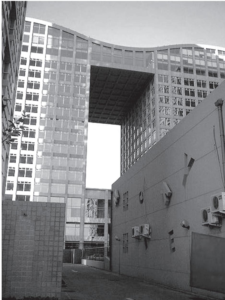
Vista hacia el conjunto de oficinas.

Con el establecimiento de la economía de mercado socialista, en particular el caso de la vivienda, este proceso de modernización se inicia en 1998 con el proceso de sustitución