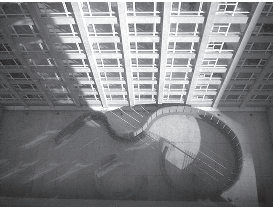
Vista hacia el patio interior desde el edificio de oficinas.