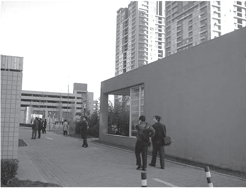
Vista general del conjunto desde la cafetería.