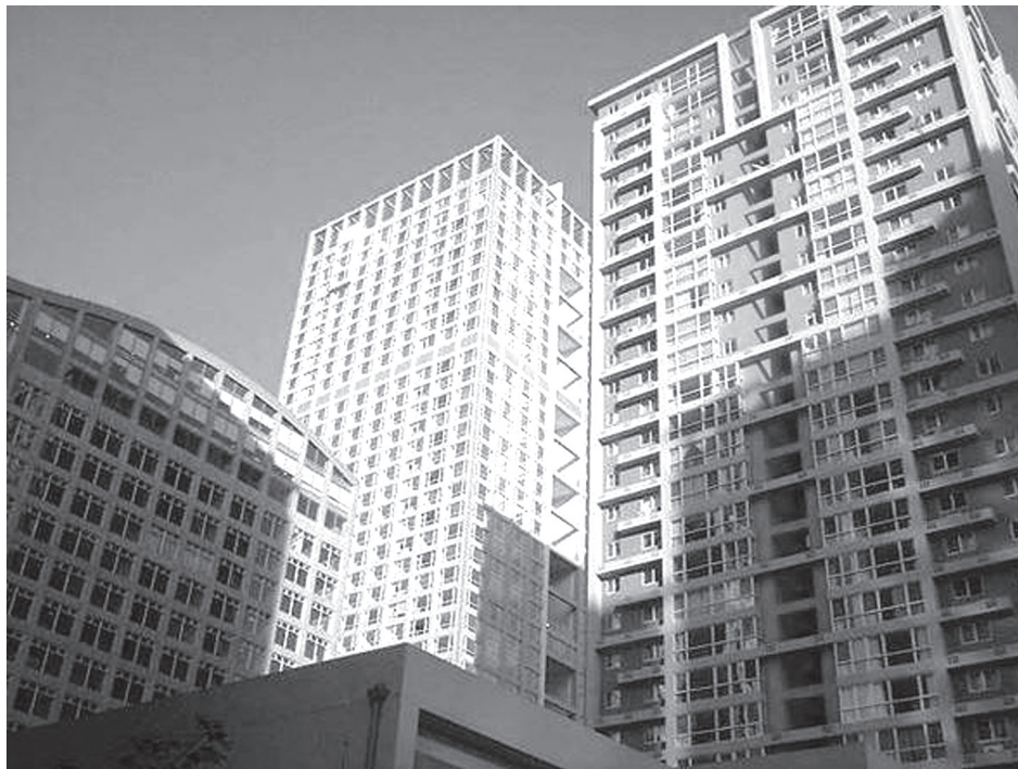
Vista hacia el edificio de oficinas y edificio de departamentos.

La ciudad nueva de Soho se ha desarrollado como una city scape brillante al este de Beijing; ésta contiene 10 edificios, adornados con nueve colores, que resguardan a ocho mil residentes y proporcionan un espacio de oficinas para siete mil personas. Seis torres de 28 niveles y una superficie cubierta gruesa de 260 000 m 2 , incluyendo 1 385 unidades de departamentos y 1 226 espacios de estacionamiento, cuatro torres interconectadas con una superficie cubierta gruesa de 220 000 m 2 , incluyendo 512 unidades de departamentos de Soho, 48 tiendas y otros espacios comerciales, 283 oficinas y 866 espacios de estacionamiento.