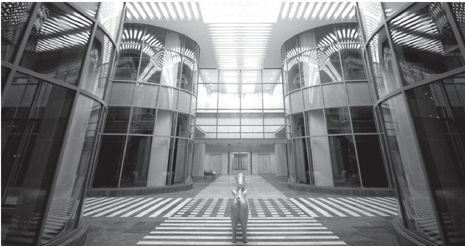
Vestíbulo entre los edificios B y C.

poráneo, lo que le da una característica de integración plástica peculiar.