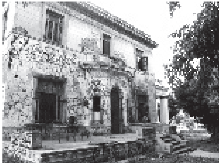
Cuartería en antigua mansión ecléctica tuguizada de El Vedado, dividida por cuartos.

del establishment , injertada en la tradicional burla machista que los clasificaba como flojos y poco confiables.