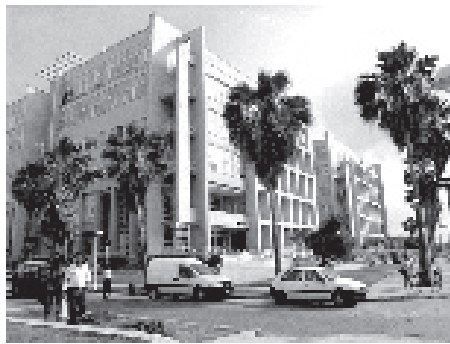
Dos de los 18 edificios de oficinas y tiendas en el Centro de Negocios del Monte Barreto Miramar.

La conservación del fondo construido resulta más difícil en las zonas urbanas centrales, donde los edificios son más altos y con mayor complicación constructiva, y también con más valor arquitectónico. La situación se agravó por décadas de una política que priorizaba otros programas de obras sociales, y dentro de la vivienda, ponía a la nueva construcción por sobre la conservación de las existentes. Esa política afectó incluso a las viviendas construidas