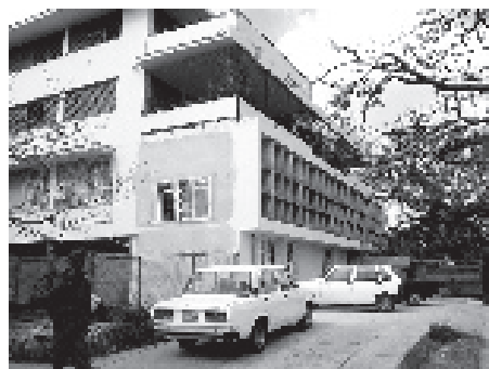
Cierres improcedentes en antigua planta baja libre, y apertura nueva en fachada.

La globalización es una realidad que no se escoge: cuando más, se puede intentar conducirla. Por un lado, favorece el contacto entre pueblos alejados, por otro, impone modelos económicos, tecnológicos y culturales cada vez más similares; lo que borra particularidades decantadas en el tiempo, favorece el desarraigo y refuerza la dependencia de los países de la periferia hacia los del centro. Este proceso va acompañado por el debilitamiento relativo del poder económico de las