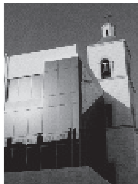
Habana Vieja, remodelación de edificio de los años 50 para colegio universitario de San Jerónimo. Fachadas en vidrio espejo, reconstrucción compleja de elementos originales hace tiempo desaparecidos, e inserción de nuevos.

Las fuertes inversiones que el gobierno revolucionario hizo desde su inicio para crear empleos y mejorar las condiciones de vida en el interior del país frenaron de manera natural la migración interna hacia la capital, convirtiendo La Habana en un caso especial dentro de América Latina. Pero esa priorización empeoró indirectamente las ya malas condiciones de vida en las áreas centrales de la capital, que son también las más pobladas y las de mayor valor cultural. El deterioro físico ha aumentado por esa tremenda crisis que siguió al desplome de la Unión Soviética, y