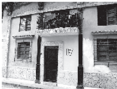
Centro Habana, cierres y pintura inapropiados en fachada.

que otra joven apetecible con debilidades ideológicas. Sus abusos llevaron a que fuera públicamente rechazado por una mayoría absoluta durante una importante asamblea de trabajadores y docentes, en un acto de rebeldía masiva y pública poco usual.