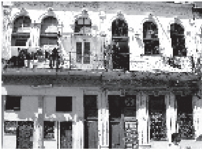
Centro Habana, subdivisiones inapropiadas, aprovechando el puntal alto original.

de principios, igual que haber votado en las elecciones de 1958. Con el tiempo, algunos de los excluidos fueron readmitidos, aunque otros se perdieron por el camino. Los criterios clasificatorios para excluirlos cambiaron, lo que deja claro que nunca fueron principios, porque los principios no cambian.