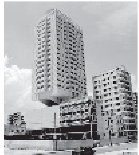
Edificio Atlantic de una empresa mixta cubano-extranjera en el malecón habanero (viviendas para extranjeros).

Más importante que la desventura individual de los arquitectos conflictivos , humillados, puestos a un lado o encargados de tareas banales, fueron las consecuencias sobre la arquitectura cubana contemporánea. Salvo excepciones, no se ha podido estar a la altura del valioso patrimonio construido que se acumula en las ciudades cubanas, incluyendo el de los primeros años tras el triunfo revolucionario. La causa principal no se debe buscar en la calificación profesional de los arquitectos cubanos, sino en las condiciones en que trabajan, y muy especialmente a la pérdida de su autoridad sobre los proyectos y la ejecución de las obras. Hubo una etapa dentro del trinquerio amargo en que el nombre mismo de arquitecto adquirió una connotación peyorativa en la jerga camaraderil