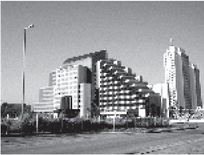
Hotel Panorama, en el Monte Barreto, costa oeste de la Habana. Cierres de vidrio y espejo fijo, que implican una carga extra sobre la climatización.

Existe una percepción generalizada de que la buena arquitectura es inevitablemente cara, pero hay buenos ejemplos por todo el mundo contruidos con materiales humildes, y muchos otros execrables hechos con los más caros. Por otra parte, el concepto de caro es relativo: en su momento, la Unidad 1 de La Habana del Este fue criticada por demasiado costosa, sin embargo, cuando ahora se revisan las cifras, son risibles. Este sigue siendo el mejor conjunto de vivienda social hecho en Cuba. Casi medio siglo después se mantiene inalterable, no solo por su buena ejecución, sino porque los inquilinos están muy claros de que si no cuidan lo que tienen, no volverán a encontrar algo parecido.