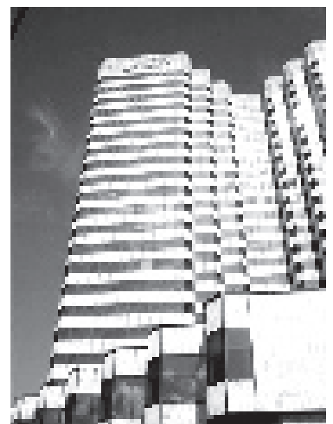
Hotel Meliá-Cohiba, de una empresa mixta cubano-extranjera, un volumen muy pesado que se echa encima de la vía.