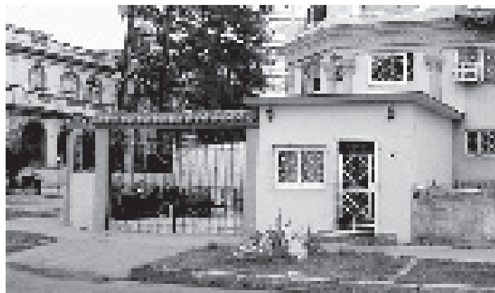
Cierre de portal y construcción en franja de jardín en casa ecléctica de El Vedado.

Comenzando los sesenta el profesor español Joaquín Rallo había revolucionado la enseñanza del diseño en la Escuela de Arquitectura de La Habana, en medio de un clima de experimentación fomentado también por otros docentes destacados. Rallo realizó importantes aportes teóricos y metodológicos, con un radicalismo militante de ultrazquierda que condensó el espíritu de aquella época, y atrajo a otros creadores relevantes de las artes plásticas y la música. También atrajo sobre sí la atención de los mediocres. Entre los defenestrados de aquella contrarrevolución cultural, él sufrió más que nadie. Fue desterrado a Jagüey Grande, donde estuvo alojado en condiciones deplorables que agravaron una enfermedad de la que nunca se quejó, y que lo mató a los 42 años.