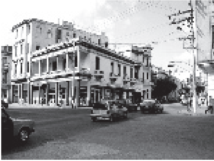
Centro Habana, colores corporativos de empresa estatal aplicados irrespetuosamente en fachadas eclécticas.

Parte de la animación de La Rampa fue también la remodelación de la antigua Funeraria Caballero en 1967, para convertirla en un centro cultural polivalente. La obra tuvo un éxito inmediato, especialmente entre la juventud, y se convirtió en un centro de reunión de los enfermitos 2 de La Rampa. Siguiendo el viejo método de botar el sofá 3 , el local se clausuró y fue convertido en taller de dibujos animados del Instituto Cubano de Radio y Televisión (ICRT), cerrado al público. Los indeseables se limitaron a cruzar la calle y pararse en la acera de enfrente. Unos bloques de chatarra prensada, que formaban la pieza donada por el gran escultor marsellés César al finalizar el Salón de Mayo, terminaron como soporte para las cadenas que cerraban el estacionamiento. Para mí, ese cierre marcó simbólicamente el comienzo del trinquenio amargo en la arquitectura , ya anticipado con la paralización de las escuelas de arte.