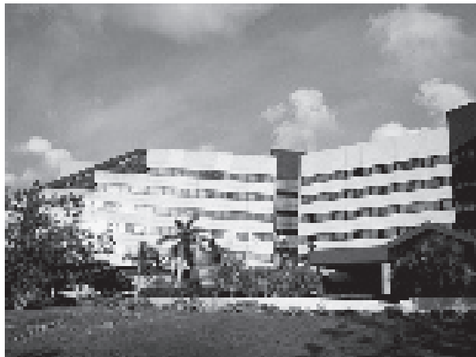
Hotel Miramar en la Quinta Avenida, empresa mixta cubano-extranjera.

A mediados de los sesenta el Ministerio de la Construcción había absorbido otras entidades constructoras competidoras, como el Instituto Nacional de Ahorro y Vivienda y el Departamento de Viviendas Campesinas del Instituto Nacional de Reforma Agraria (INRA), 4