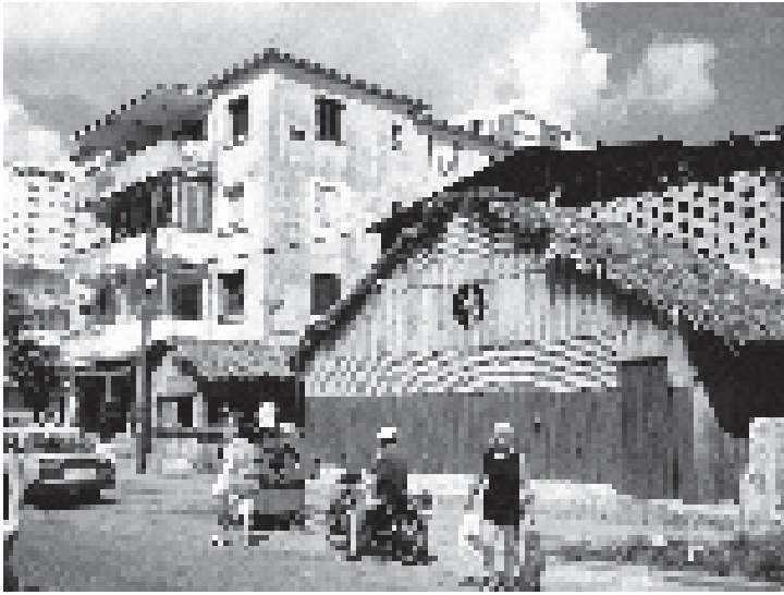
La ruralización de la capital: ranchón de palma en El Vedado, sin siquiera respetar la distancia a la calle.

futuras generaciones resuelvan las suyas, aun aquellas que ahora se desconocen; mantenerse dentro de la capacidad de carga del sistema para permitir su autorregeneración, o la necesidad de que un elemento pueda desarrollar varias funciones y permitir que una misma función pueda ser desempeñada por varios elementos distintos. Lo anterior demanda preservar la diversidad y la pluralidad, y permitir una participación activa y consciente de la población en la identificación y solución de sus propios problemas. Curiosamente, estos sanos principios despertaron recelos en los dogmáticos.