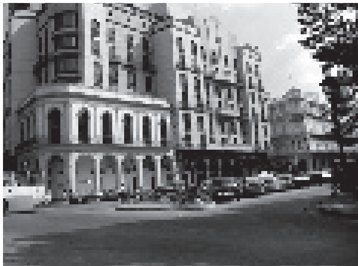
Hotel Parque Central, empresa cubano-extranjera. La integración con la ruina incorporada se intentó por analogía, resultando en una mimesis banal.

Hacer funcionar la ciudad y mantener el control sobre ella requiere adelantarse al cambio, pero imaginar el futuro es siempre un ejercicio que puede pasar de lo divertido a lo aterrador. Quizá sea mejor concentrarnos en este momento, y responder a esta pregunta: ¿Estamos haciendo la clase de arquitectura que merece este país? Desde este medio siglo de afares, ilusiones y riesgos compartidos, quiero ver desde adentro lo que va a pasar, y ayudar con todos ustedes a que salga lo mejor posible □