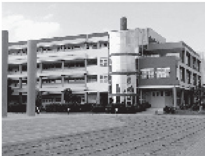
Una de las Facultades de la Universidad de Ciencias Informáticas, Autopsia del Medio Día.

Un caso especial ha sido el complejo del Monte Barreto en el oeste de La Habana, con 7 hoteles, 18 edificios de oficinas y tiendas y 1 condominio para extranjeros. Monte Barreto se afilió a un modelo disperso de desarrollo suburbano, dependiente del auto privado, que ha sido muy criticado en los países que primero pasaron por eso. Ese conjunto es para una sola moneda, la dura, y para un solo tipo de gente, la que tiene acceso a ella. No existen viviendas para la población, ni los servicios cotidianos que las complementan. Todo eso convierte al conjunto en un enclave de riqueza, desligado del resto de la ciudad, con el peligro de que algún día a alguien se le ocurra cercarlo.